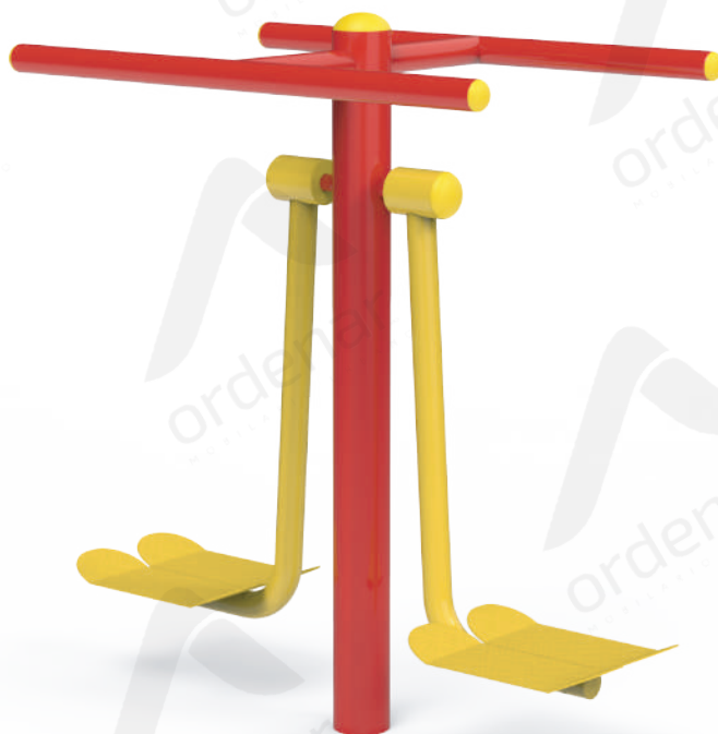
Imagen referencial. Para más información ingrese a www.ordenarmobiliario.com.ar