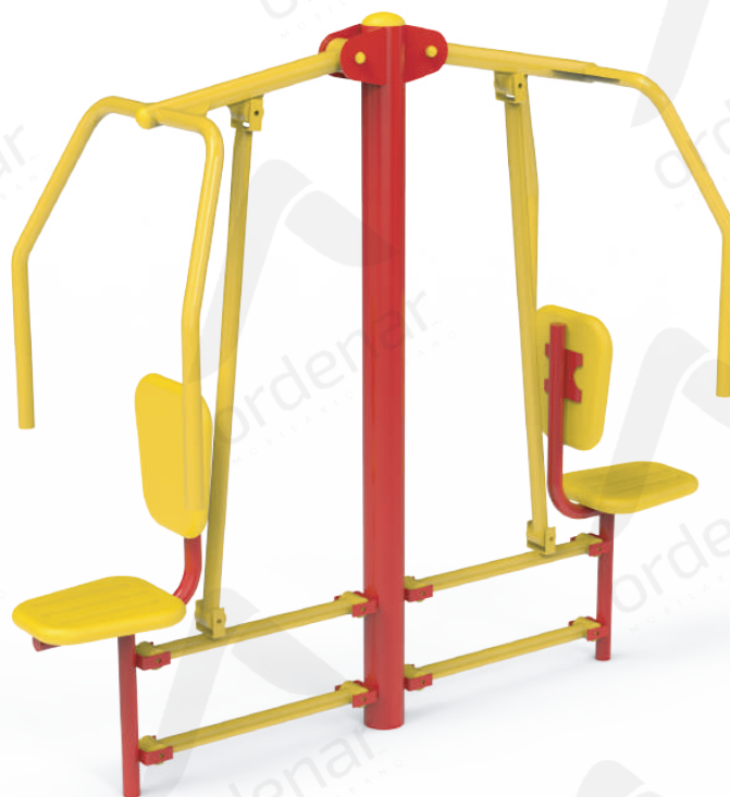
Imagen referencial. Para más información ingrese a www.ordenarmobiliario.com.ar