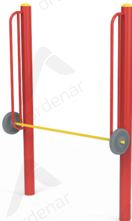
Imagen referencial. Para más información ingrese a www.ordenarmobiliario.com.ar